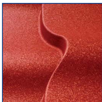
Внешний вид покрытия