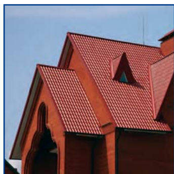
Внешний вид кровли